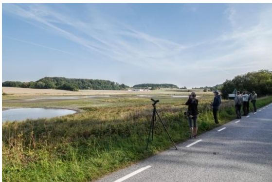
Börninge mad eller Sörby kratt