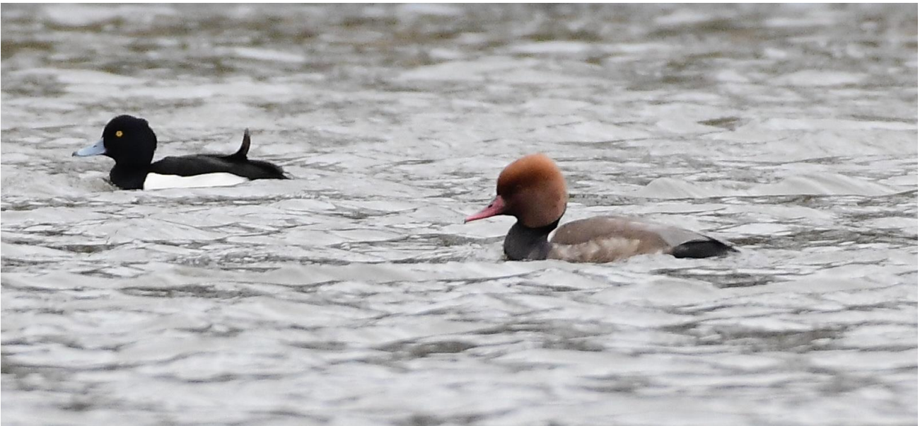
Rödhuvad dykand tillsammans med en vigg.

den närliggande pizzerian där alla kunde hitta god mat efter eget önskemål. Väderprognosen för söndagen talade om mkt frisk SO med 11 m/s i medelvind och 17 m/s i byarna. Gemytlig klubbkänsla och planering för nästa dag innan nattsömn väntade.