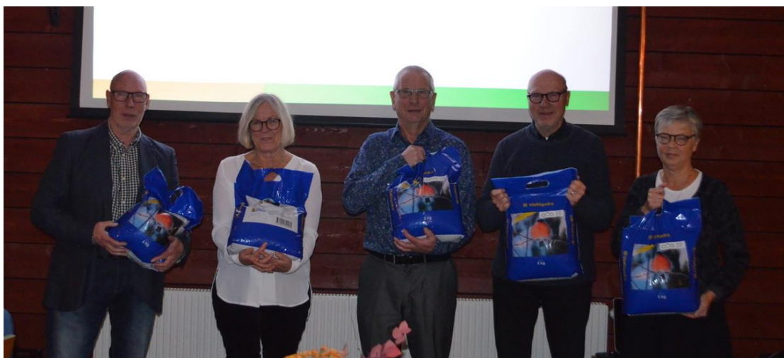
Vinnarna av Martins Fåglar i Aneby-tävling.