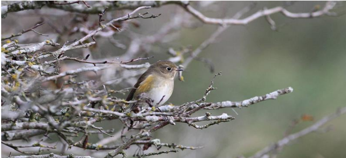
Blåstjärt, kan det bli en ny Höglandsart.