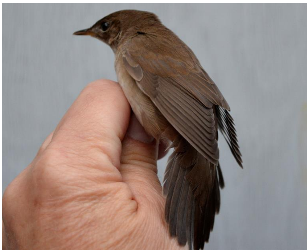
Vassångare M Thorin.

Beroende av väder sker detta Lör. eller Sön. Vill du vara med och hjälpa till vid ringmärkning, ring Mats Thorin 038041158 eller 0702628798.